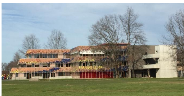
Photo du nouveau bâtiment de l'UFR DEG de l'UPPA